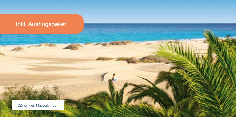
Dünen von Maspalomas

Reiseveranstalter: BigXtra Touristik GmbH Landsbergerstraße 88 80339 München täglich 8 - 22 Uhr (Ortstarif)