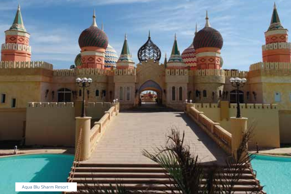
Aqua Blu Sharm Resort

Ägypten – Wunderschönes kristallklares Meeresblau und eine atemberaubende Unterwasserwelt faszinieren jeden Urlauber. Egal, ob Sie Sonnenanbeter, Kitesurfer, Schnorchler oder Taucher sind, hier werden Sie einen unvergesslichen Urlaub erleben. Im Süden der Halbinsel Sinai, umspült vom Wasser des Roten Meeres, liegt die beliebte Ferienregion Sharm El Sheikh. Wunderschöne Badebuchten mit einer faszinierenden Unterwasserwelt auf der einen und das beeindruckende Sinai-Gebirge mit zahlreichen Ausflugsmöglichkeiten auf der anderen Seite versprechen einen abwechslungsreichen Urlaub.