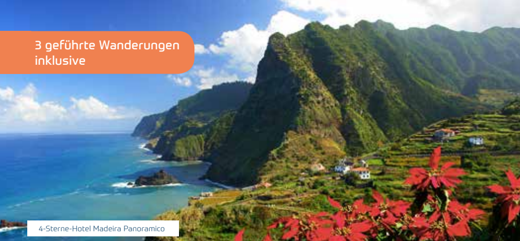
4-Sterne-Hotel Madeira Panoramico

Wanderreise auf dem schwimmenden Garten – Malerische Fischerdörfer, atemberaubende Wasserfälle, tiefe Schluchten, Naturschwimmbäder sowie Felsformationen kennzeichnen die Schönheit Madeiras. Erleben Sie dieses Naturschauspiel während der bereits inkludierten Wanderausflüge.