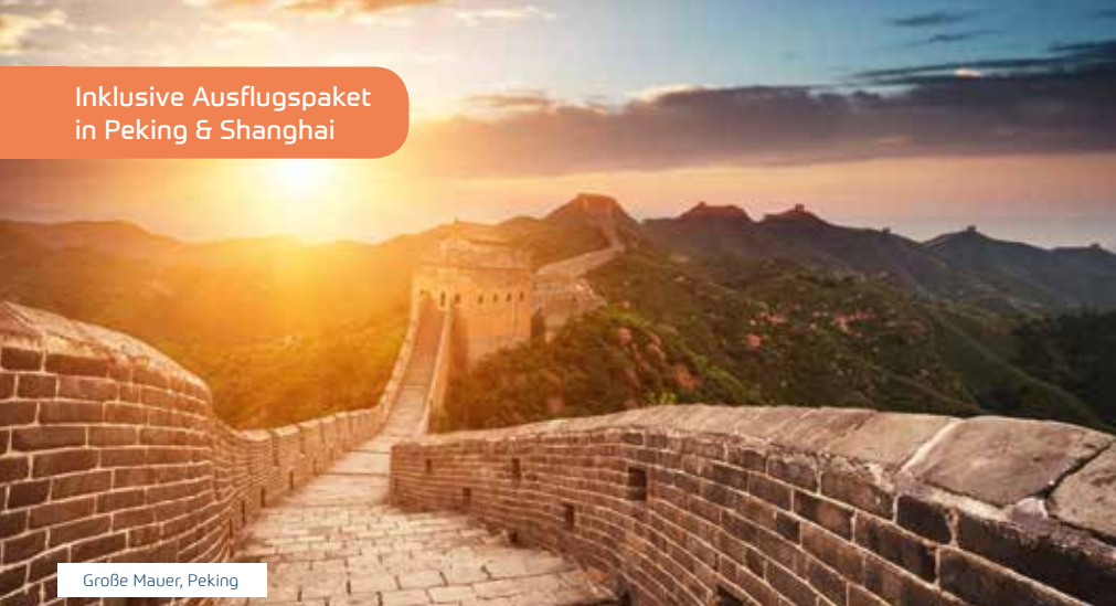
Große Mauer, Peking

Inklusive Ausflugspaket in Peking & Shanghai