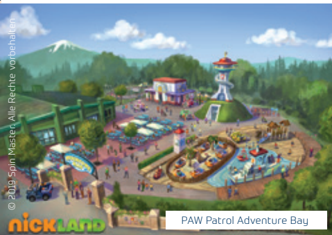
PAW Patrol Adventure Bay