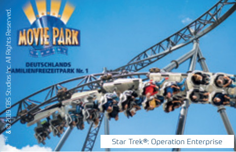
Star Trek®: Operation Enterprise