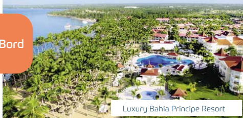
Luxury Bahia Principe Resort