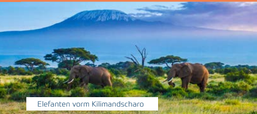
Elefanten vorm Kilimandscharo

Inkl. 6 Nächte Badeaufenthalt im 5-Sterne-Hotel Bluebay Beach Resort & Spa auf Sansibar