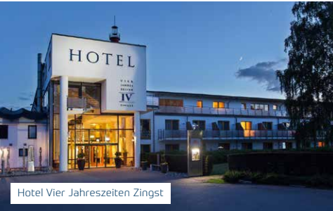
Hotel Vier Jahreszeiten Zingst