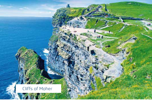
Cliffs of Moher

Ihr Vorteilspreis ab € 444,- statt ab € 644,-. Sie sparen € 200,- p.P. bei Buchung bis 31.10.2019