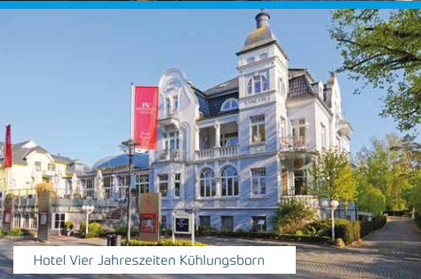
Hotel Vier Jahreszeiten Kühlungsborn