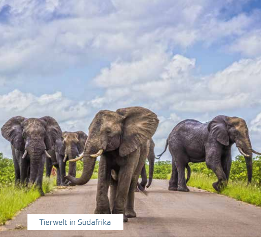
Tierwelt in Südafrika

Reiseveranstalter: Falk Travel DE GmbH täglich 8 - 20 Uhr (Ortstarif)